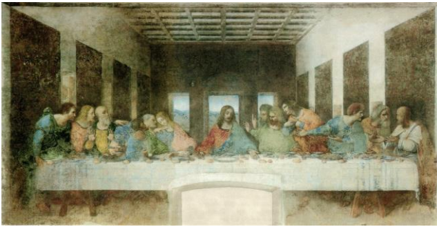
La cène par Léonard de Vinci (1490)