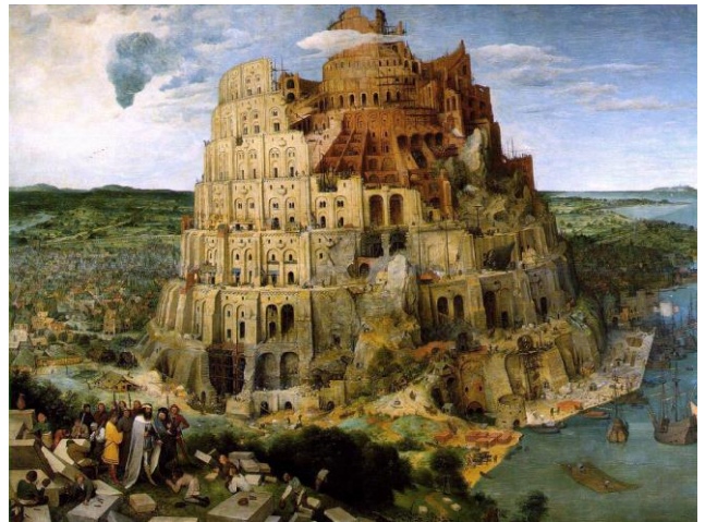
La tour de Babel de Pieter Bruegel l'Ancien