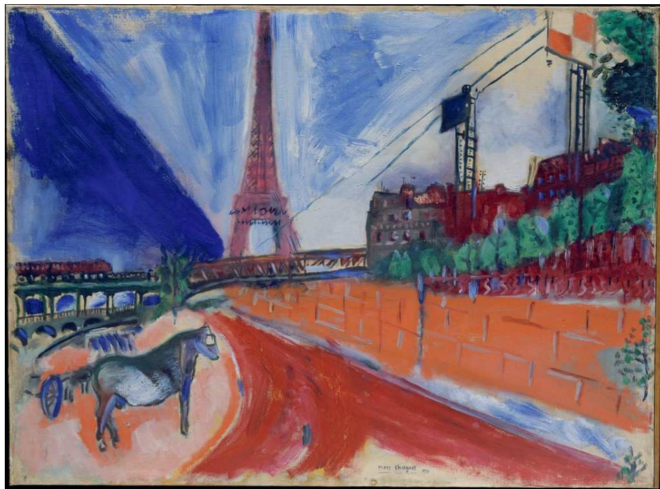
Le Pont de Passy et la Tour Eiffel (1911) de Marc Chagall (1887-1937)

Le peintre organise son tableau en plaçant les éléments dans l'espace. La perspective permet de représenter les personnages et les objets en 3 dimensions dans l'espace alors qu'ils sont peints sur une toile. Le spectateur distingue alors plusieurs plans : le 1 er plan (le plus proche de nous), les plans intermédiaires, puis l'arrière plan (le plus éloigné).