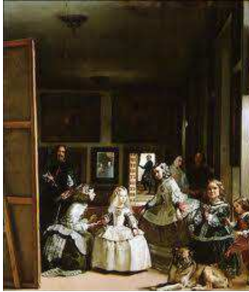
Les Ménines (1656) de Diego Velasquez (1599-1660)