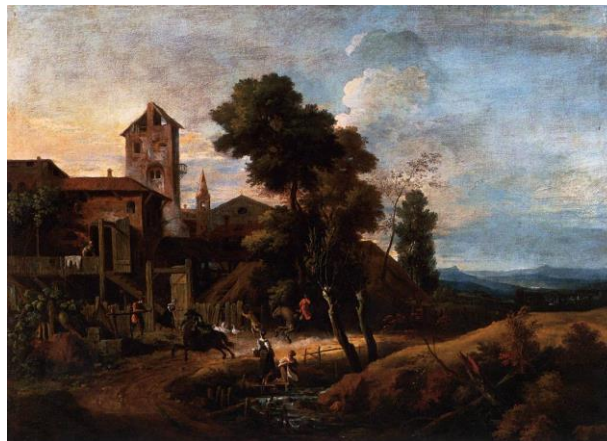
Paysage par Marco Ricci

Replacez sur la frise chronologique les différentes œuvres vues dans la séquence.