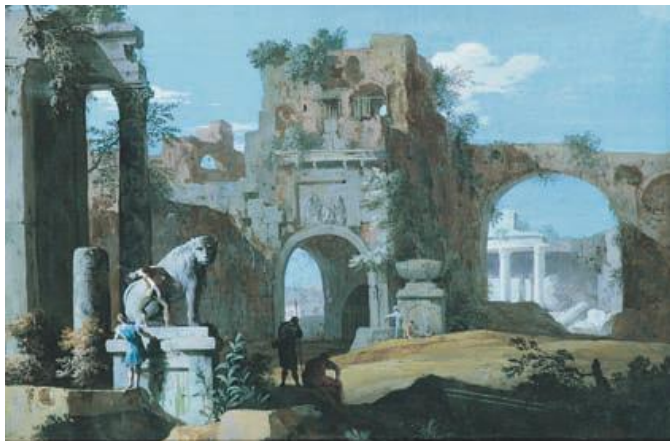
Paysage classique aux ruines par Marco Ricci (no 1892)

Les concertos des Quatre Saisons sont inspirés de tableaux du peintre Marco Ricci. On appelle musique à programme une pièce musicale qui raconte une histoire ou dépeint une scène. Les Quatre Saisons de Vivaldi sont un modèle du genre et ont révolutionné la musique en leur temps. Bien sûr, il n'est pas indispensable d'en connaître les détails picturaux pour apprécier ces concertos, mais il est amusant de rechercher les correspondances entre la musique et les images. Les Quatre Saisons ont été conçues comme un tour de force artistique associant peinture, poésie et musique. À l'époque, cette œuvre a soulevé un enthousiasme comparable à celui que suscite aujourd'hui la sortie d'un film attendu avec impatience.